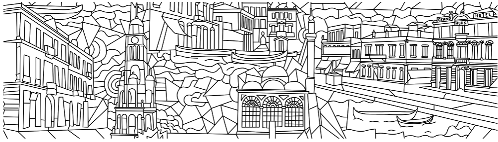
Soteur- Σωτήρης Φωκέας. Όνειρο, Ακρυλικό και μελάνι σε καμβά (190 X 520 εκ.) 2022.