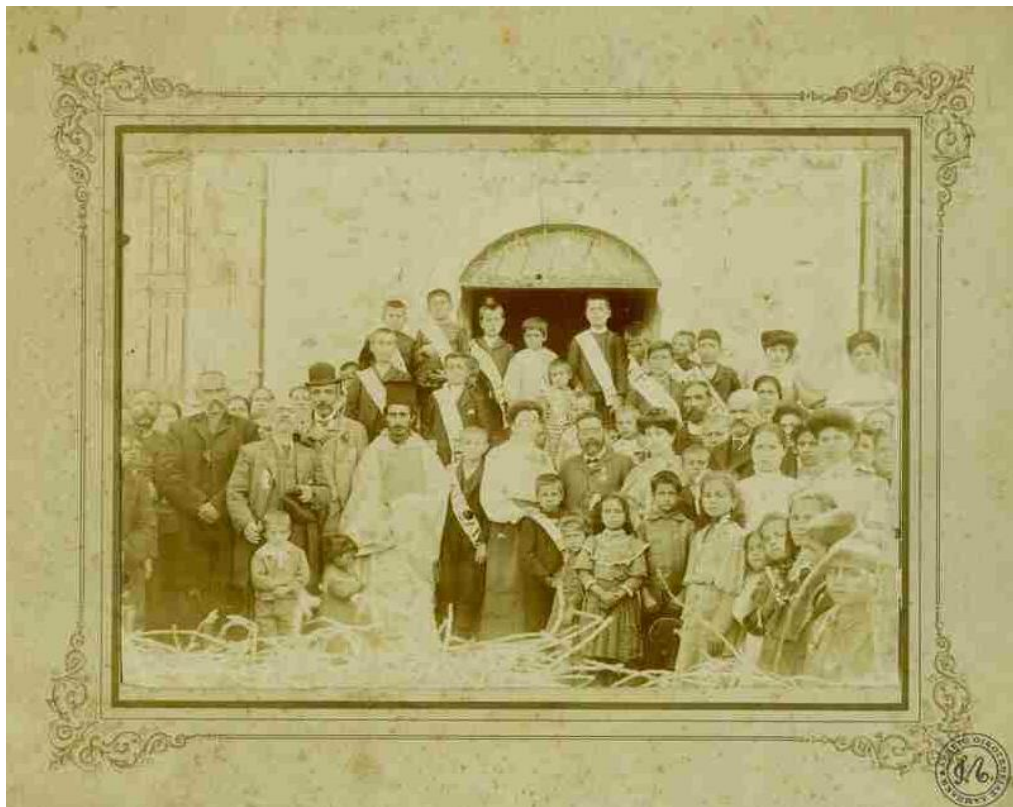
Φωτογραφία με παιδιά πιθανόν από σχολείο ή σύλλογο στη Σμύρνη.