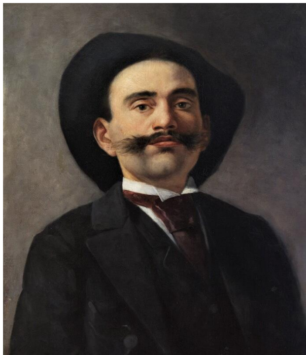
Εμμανουήλ Λαμπάκης, Αυτοπροσωπογραφία, 1894. Λάδι σε μουσαμά. Αρχείο Οικογένειας Λαμπάκη